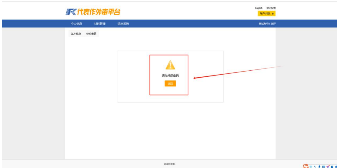
1.3 首次登录需修改密码，点击返回会自动跳转至修改密码界面